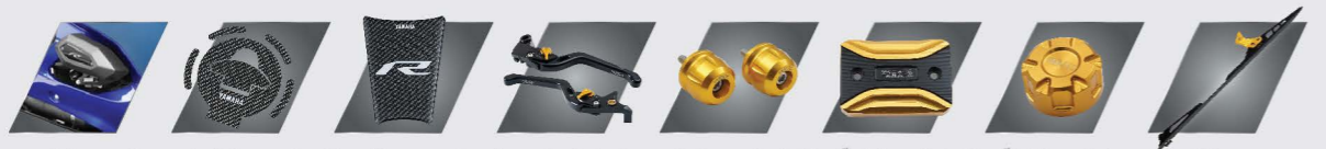
ชุดกันลื่น / แผ่นเรซินกันฝ่าเท้า / สติ๊กเกอร์กันรอย / ชุดมือเบรก & มือคลัตช์ / ชุดจุดยึดปลายแฮนด์ / ฝาปิดเบาะ / ฝาปิดเบาะ / ฝาปิดเบาะ / ฝาปิดเบาะ

*รับประกันคุณภาพชิ้นส่วนใน 3 กลุ่มหลัก ได้แก่ กลุ่มเครื่องยนต์ กลุ่มโครงสร้าง และกลุ่มระบบไฟฟ้า โดย บริษัท ไทยยามาฮ่ามอเตอร์ จำกัด สอบถามรายละเอียดเพิ่มเติมได้ที่ ศูนย์จำหน่ายและบริการยามาฮ่าทั่วประเทศ หรือศึกษารายละเอียดเพิ่มเติมที่ www.yamaha-motor.co.th **ภาพถ่ายเพื่อใช้ประกอบการโฆษณาเท่านั้น *** สงวนสิทธิ์การโฆษณาบนสื่อที่ปรากฏในภาพอาจแตกต่างกันจากสิ่งจริงเล็กน้อย เนื่องจากข้อจำกัดของระบบพิมพ์