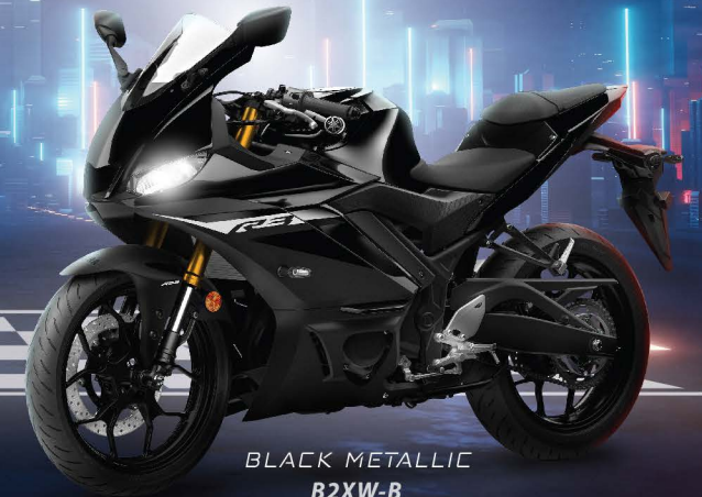
BLACK METALLIC B2XW-B