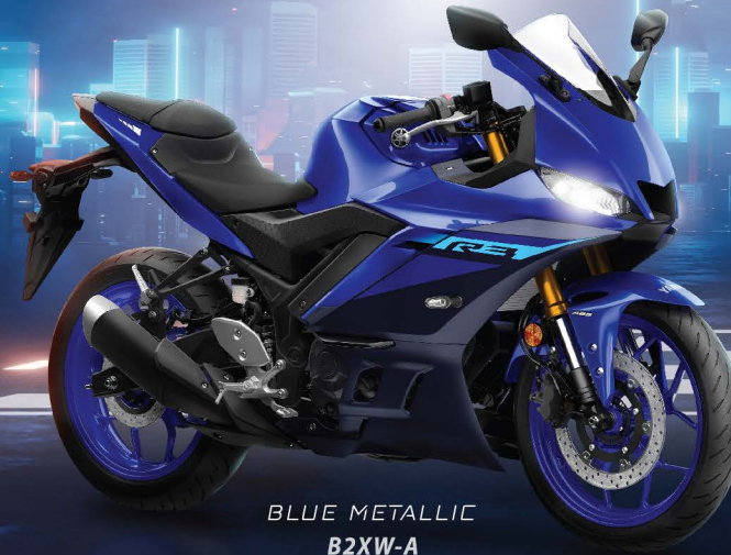
BLUE METALLIC B2XW-A