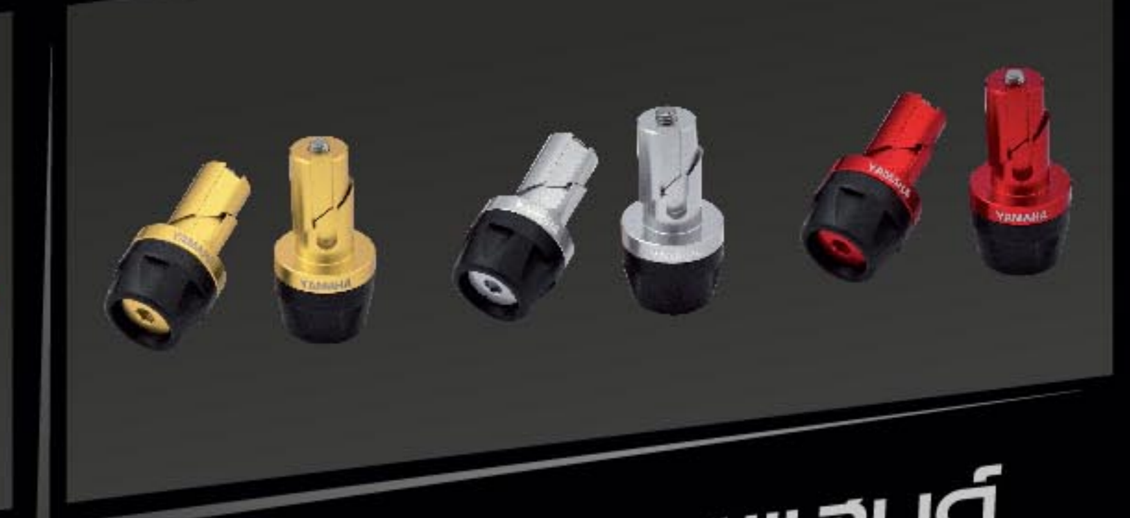
ชุดจุกปิดปลายแฮนด์