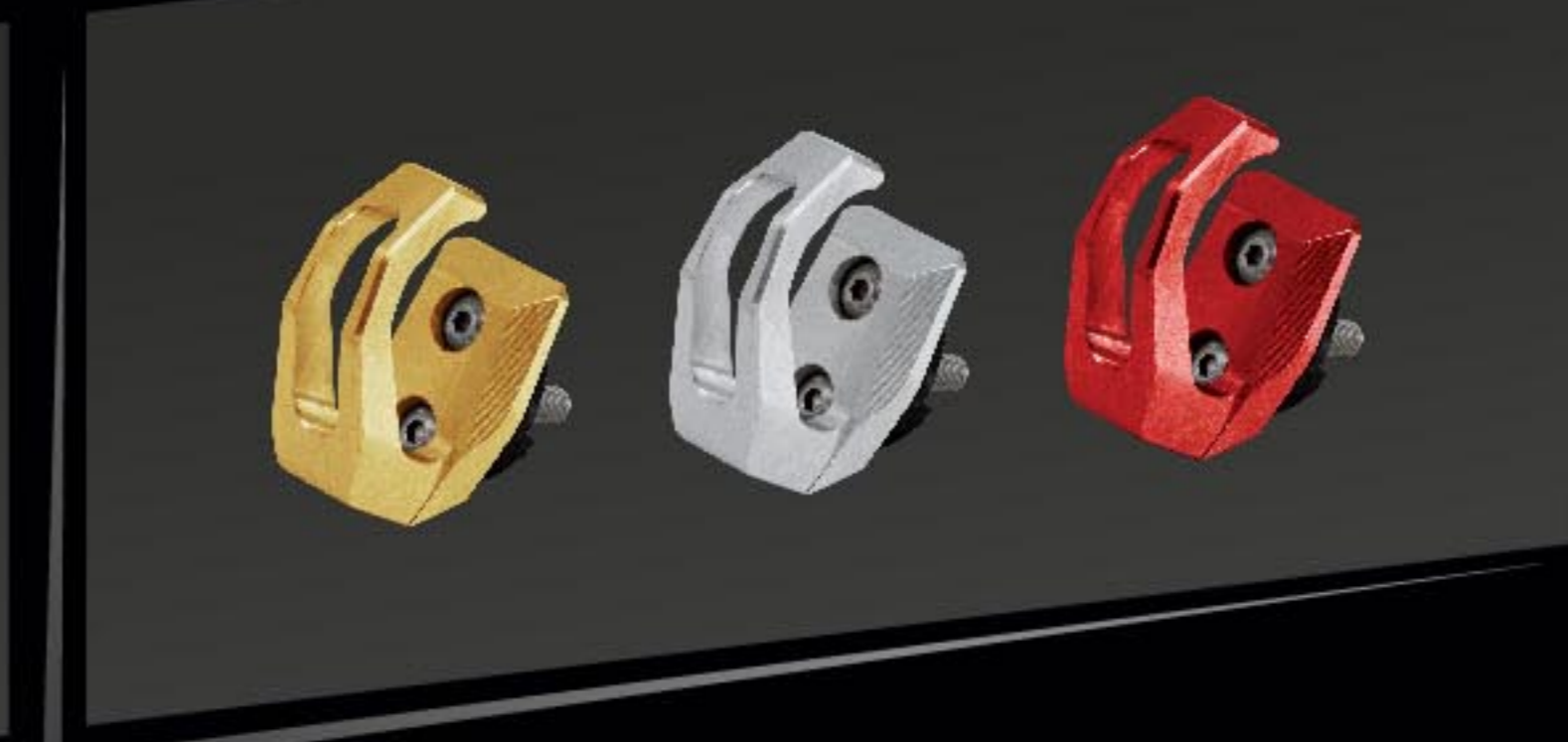
ชุดท่อเกี่ยว