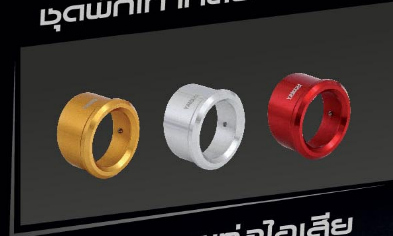
ครอบปลายท่อไอเสีย