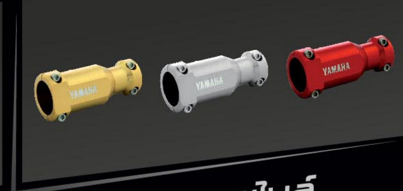
ฝาครอบสายโบลี