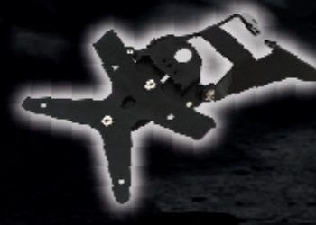
ชุดยึดแผ่นป้ายทะเบียน แบบสั้น