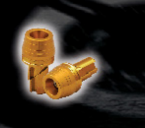
จุกปิดปลายแชนด์