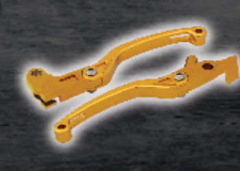
ชุดก้านเบรกและคลัตช์