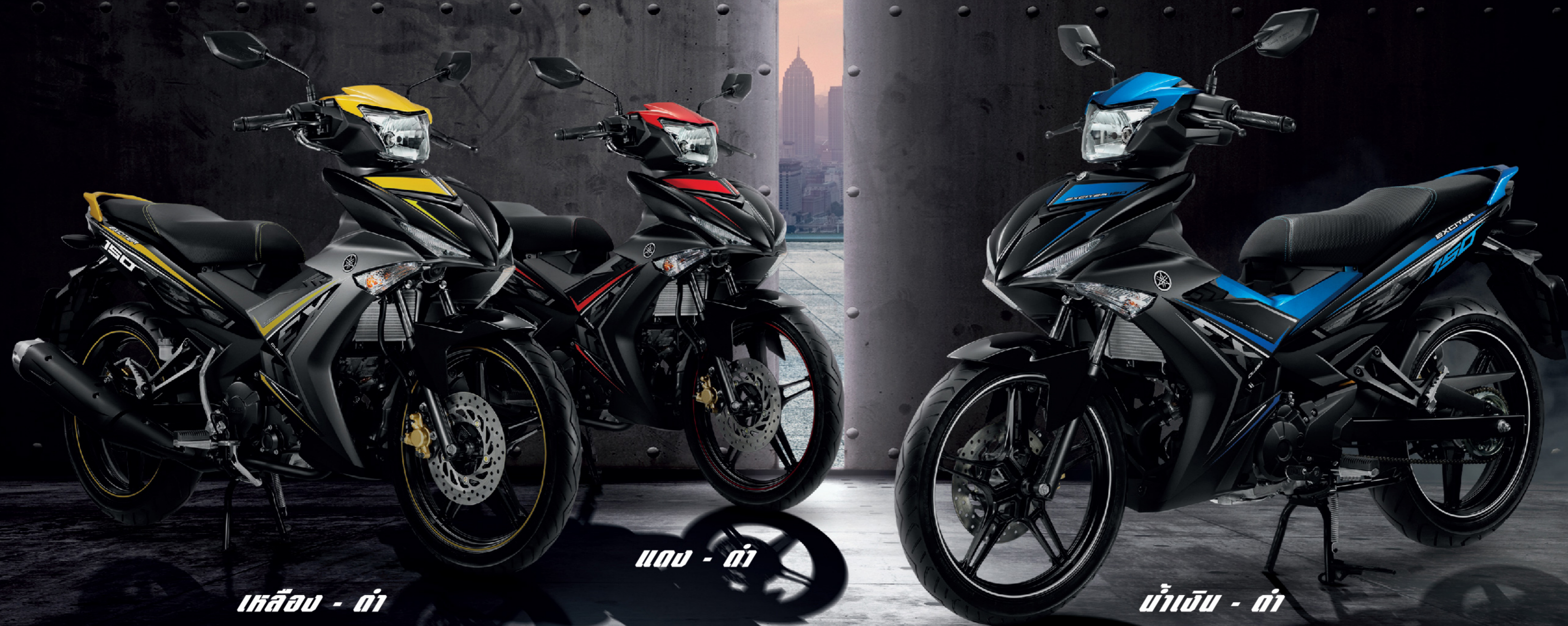
เหลือง - ดำ

*บริษัทฯ ขอสงวนสิทธิ์การเปลี่ยนแปลงข้อมูลโดยไม่ต้องแจ้งให้ทราบล่วงหน้า