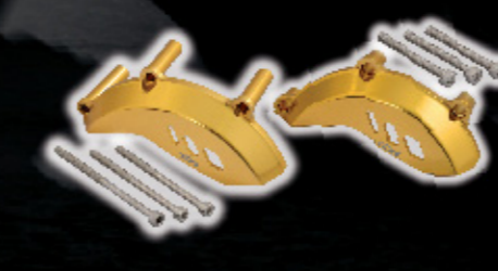
การ์ดฝาดครอบแครง ช้ายขวา

เชิญเลือกและเป็นเจ้าของ ยามาฮา เอ็กซ์ไซเตอร์ 150 ใหม่ ได้วันนี้