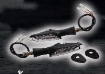
ไฟเลี้ยวแต่ง หลอด LED หมายเหตุ : ต้องเปลี่ยนรีเลย์ ไฟเลี้ยวเป็น 2WD-H3351-00