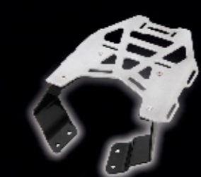
ชุดตะแกรงหลัง

แต่งให้สปอร์ตเร้าใจสุด ๆ กับชุดแต่งและอะไหล่แท้ จากยามาฮาในราคาพิเศษ