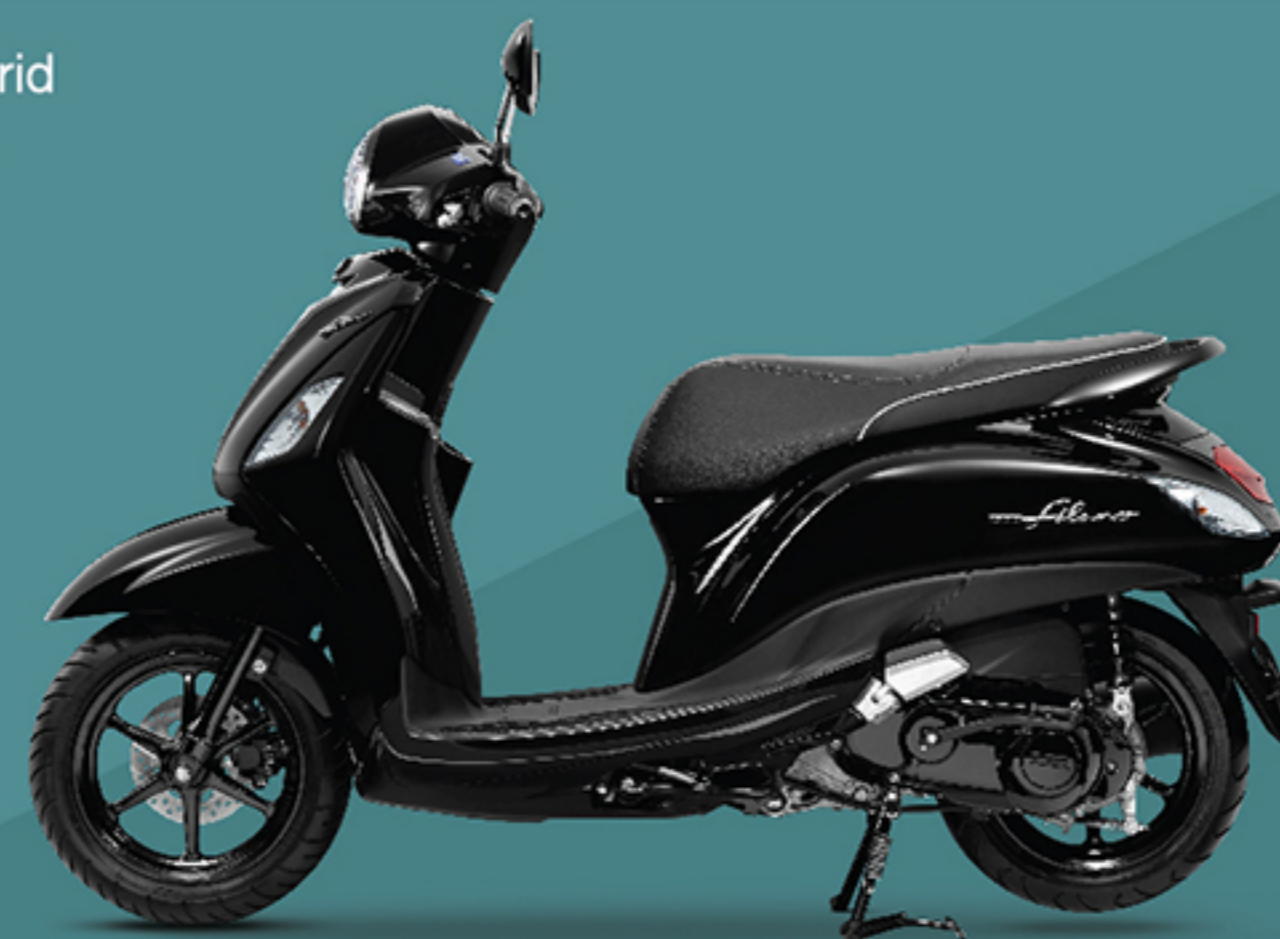
รุ่น Hybrid (B8B4) ดำ