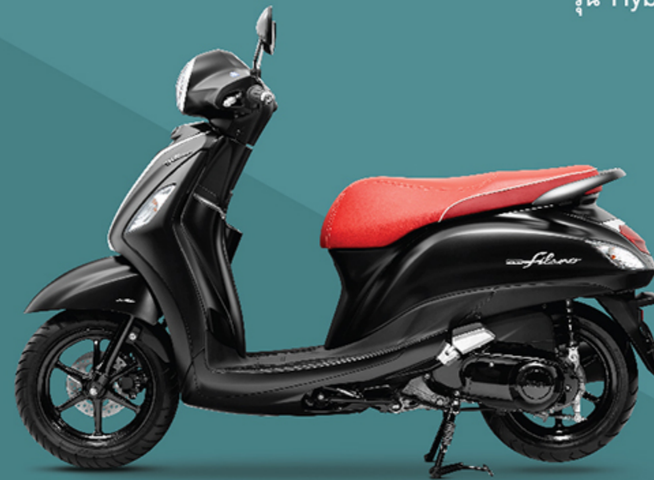
รุ่น Hybrid ABS (B8B5) ดำ