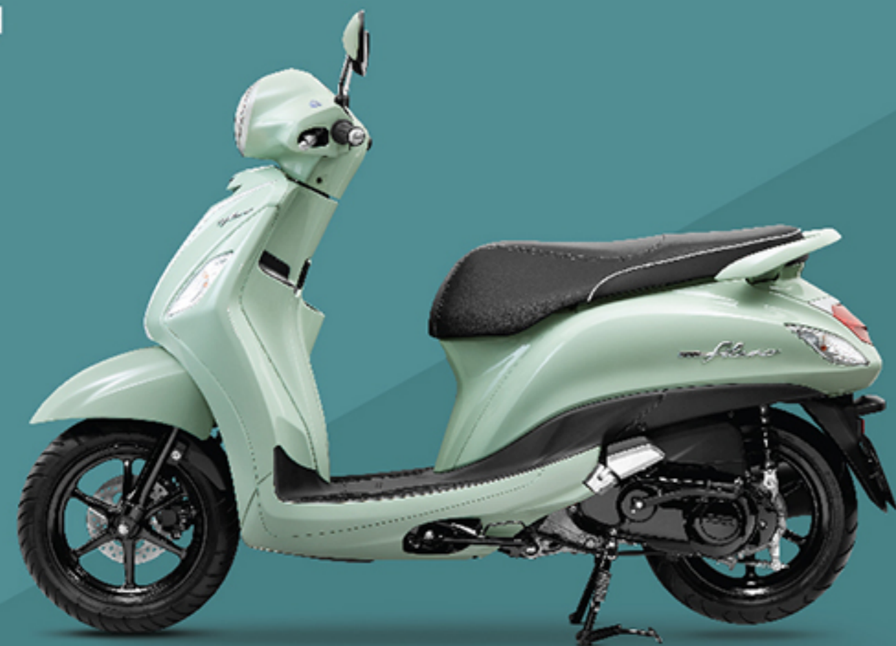
รุ่น Hybrid (B8B4) เขียว