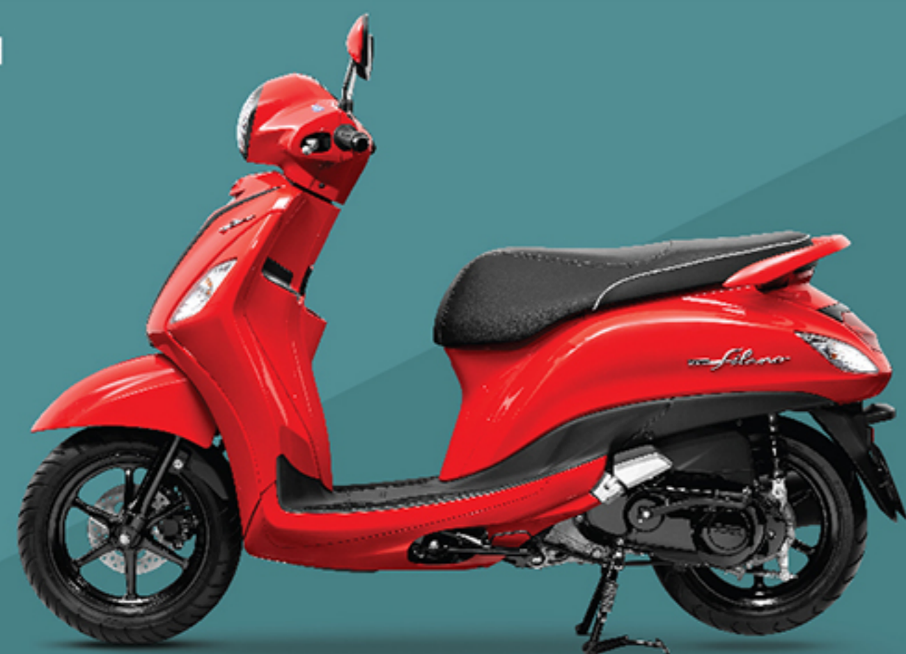
รุ่น Hybrid (B8B4) แดง