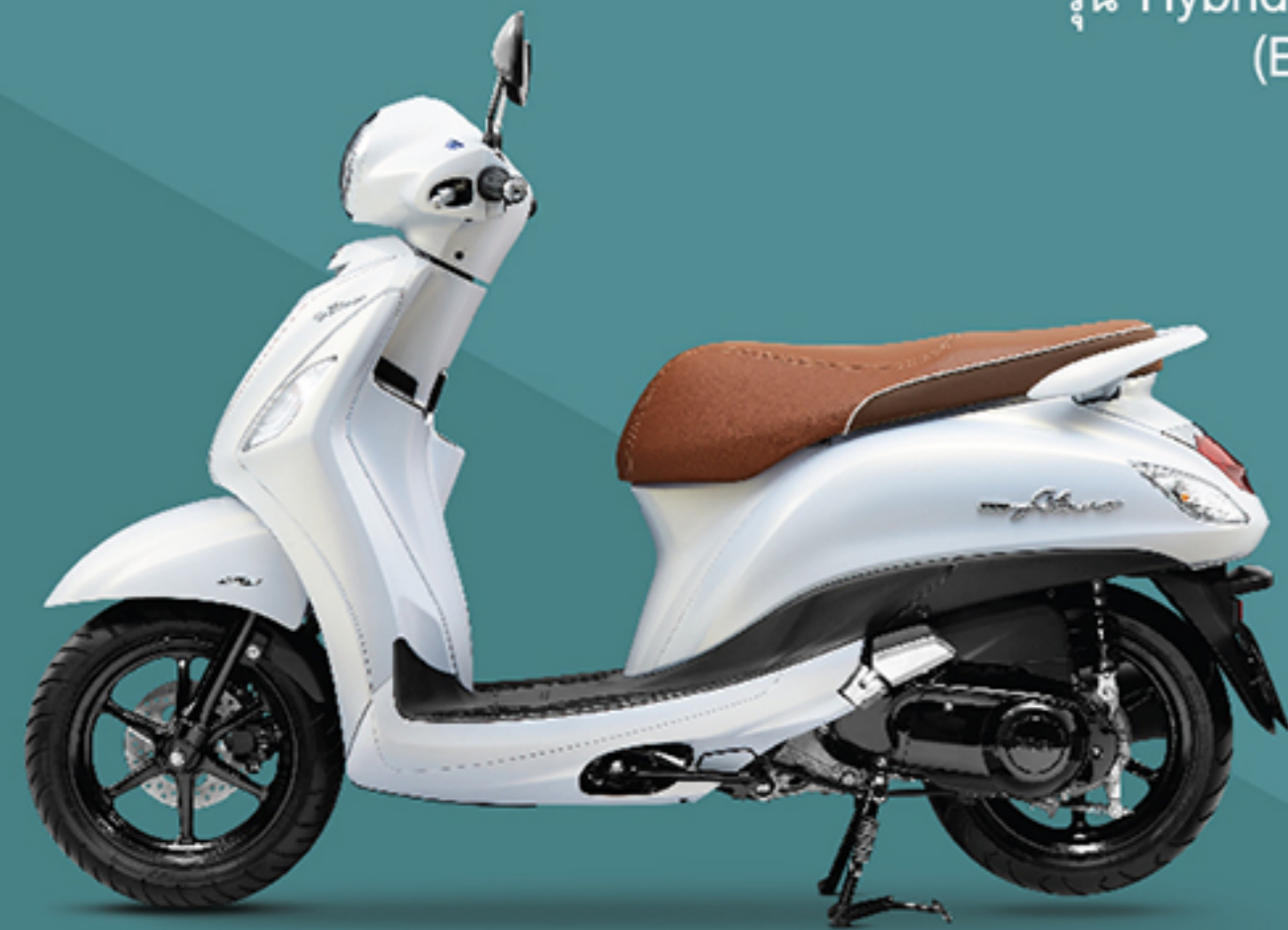
รุ่น Hybrid ABS (B8B5) ขาว