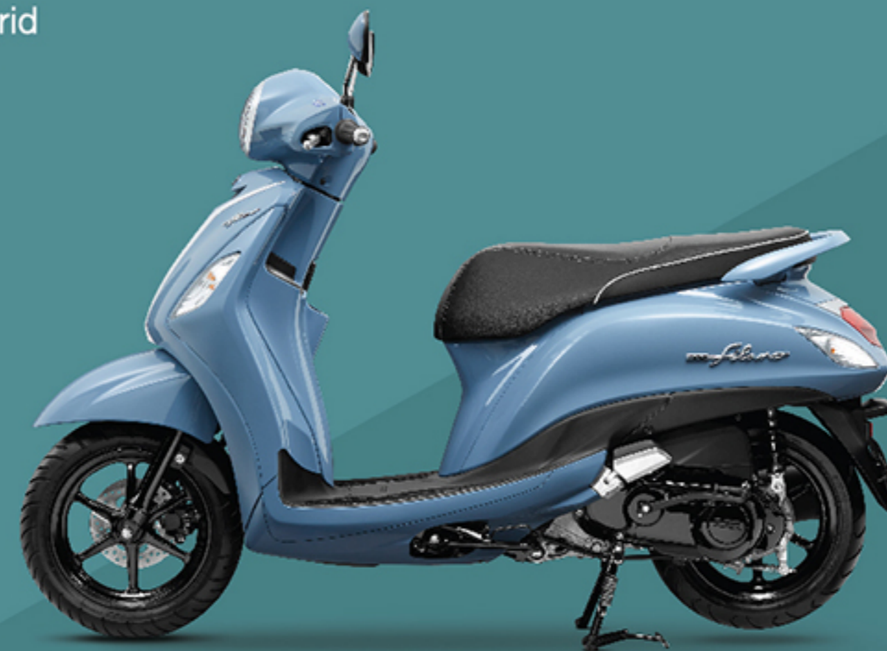
รุ่น Hybrid (B8B4) ฟ้า