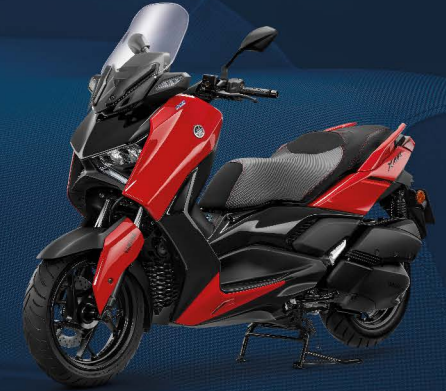
แดง-ดำ (Ruby Red)