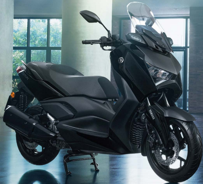
ดำ (Midnight Black)