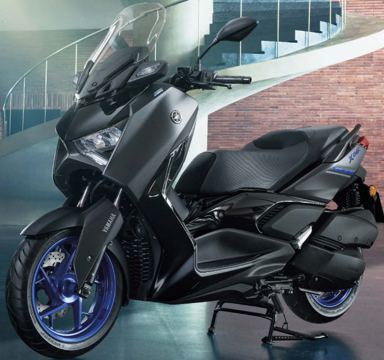
เทา-ดำ (Shadow Gray)