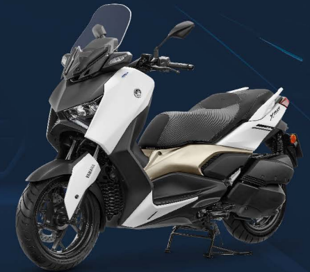
เทา (Ice Fluo)

it's automatic ผู้นำอัตโนมัติ ต้อง ยามาฮา