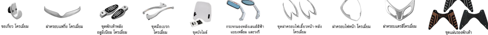
ชอเกียว โครเมียม, ฝาครอบแฟริ่ง โครเมียม, ชุดพักเท้าหลัง อลูมิเนียม โครเมียม, ชุดมือเบรก โครเมียม, ชุดบังไมล์, กระจกมองหลังเลนส์สีฟ้า แบบเหลี่ยม และวงรี, ชุดฝาครอบไฟเลี้ยวหน้า-หลัง โครเมียม, ฝาครอบไฟหน้า โครเมียม, ฝาครอบเดรสโครเมียม, ชุดแผ่นรองพักเท้า

เชิญเลือกชมและเป็นเจ้าของ ยามาฮา พิโน้ 25 ได้แล้ววันนี้