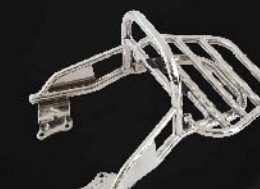
ชุดตะแกรงหลังพับได้ สเตนเลส