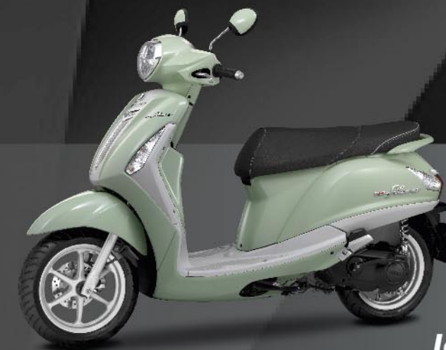
เขียว-เทา