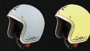
หมวกกันน็อค

แต่งหรือเติมเสน่ห์ให้มิกคลาส...สมารถใส่สไตล์คุณ ด้วยอุปกรณ์ตกแต่งราคาพิเศษจากยามาฮ่า