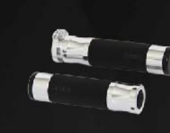
ชุดปลอกแฮนด์อะลูมิเนียม