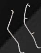
กันชนบังลมซ้าย-ขวา สเตนเลส