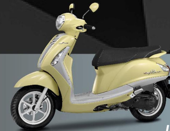
เหลือง-เทา