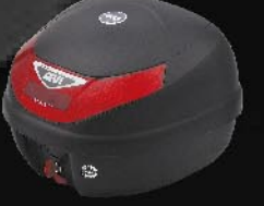
กล่องหลัง ขนาด 30 ลิตร