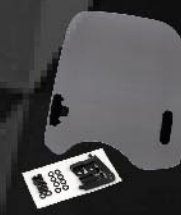
ซูดบังไมล์