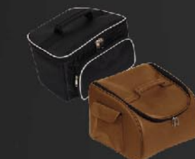
กระเป๋าสสำหรับกล่องใต้เบาะ ชุดกระเป๋าสใส่ของอเนกประสงค์